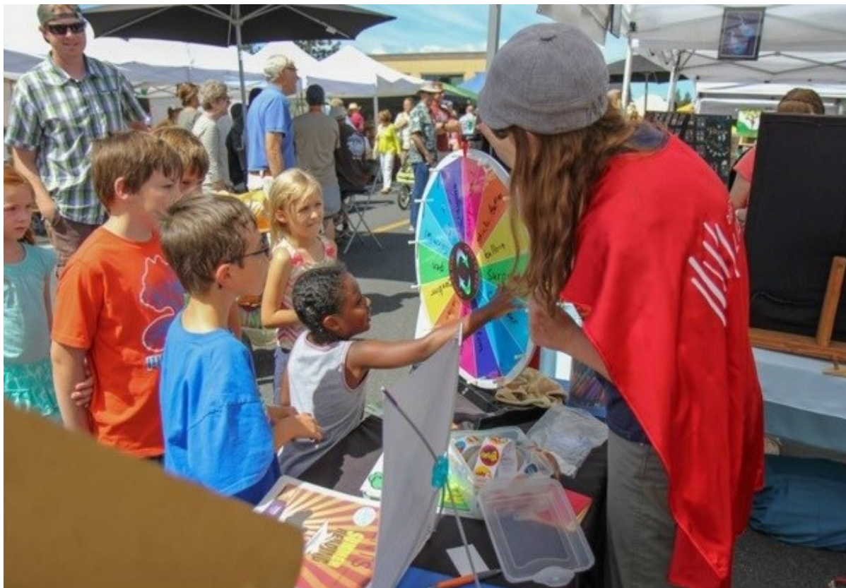
Deschutes Public Library—Summer Reading 29

Há outros exemplos que podem nos inspirar além dos citados pelo material, que também realizam práticas nessa linha. Um deles é o do sistema de Bibliotecas Públicas de Deschutes 28 , em Oregon nos EUA, inspirados no entendimento da comunidade e de sua dinâmica inovaram na maneira de oferecer serviços para seus usuários. Os funcionários viraram “ bibliotecários comunitários ” saíram para ruas e começaram a participar das atividades civis.