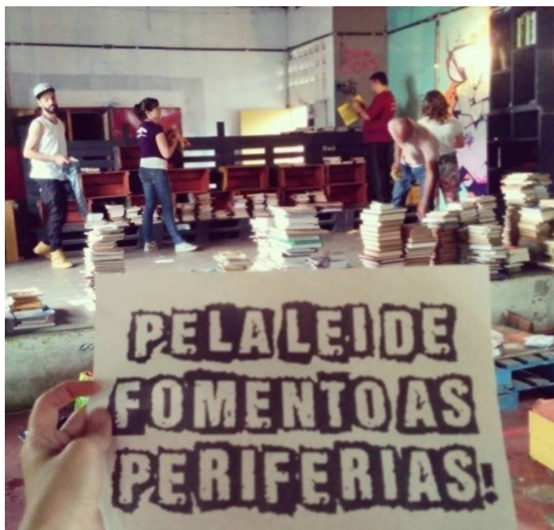
Dia de Mutirão no CICAS

Limpamos todos os livros, definimos coletivamente quais livros deveriam ser descartados, organizamos por temas e sinalizamos os locais com plaquinhas identificadoras dos temas. O dia começou com um punhado de livros e acabou com uma biblioteca. Essa era a nossa sensação e o que enxergávamos nos olhos dos nossos parceiros do CICAS, que haviam nos acolhido e ainda tinham dúvidas do que iríamos fazer por lá.