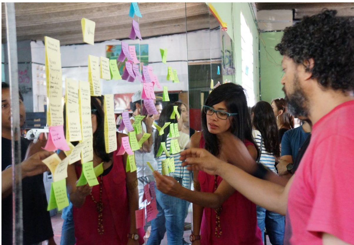
Criação dos Desafios para a Biblioteca do CICAS

Em troca, eles nos dariam um propósito pelo qual poderíamos implementar o design thinking e desenvolver um projeto de inovação social. A criação dos desafios, uma das etapas importantes das primeiras fases do processo de design thinking, foi feita diretamente no CICAS, e pudemos nos aproximar das pessoas ao mesmo tempo em que começávamos a entender um pouco de sua realidade.